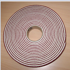
Abdichtung und Kantenschutz